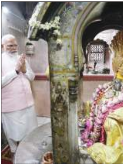
प्रधानमंत्री नरेंद्र मोदी ने पुष्कर में भगवान ब्रह्माजी के किये दर्शन-पूजन और विधिवत पूजा अर्चना की।